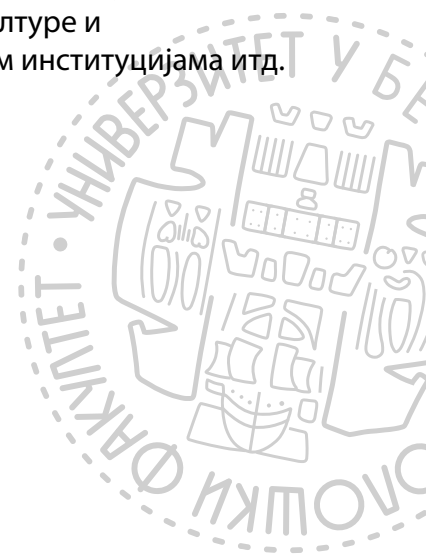
Теодора Милетић, алумниста

Пратите нас на друштвеним мрежама: Instagram