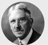
Џон Дјуи филозоф и психолог