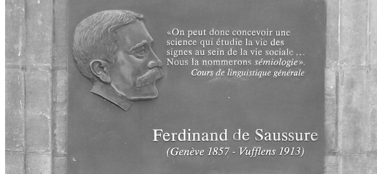
Ferdinand de Saussure (Genève 1857 - Vufflens 1913)

Univerzitet u Beogradu Filološki fakultet